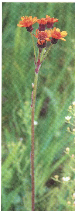
SENECIO BESSERANUM MINDER.

МАТЕРІАЛИ ІІІ МІЖНАРОДНОЇ НАУКОВОЇ КОНФЕРЕНЦІЇ